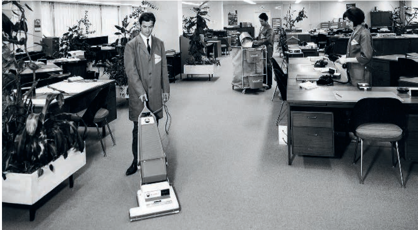
70er-Jahre: Sauberkeit im Wandel der Zeit – ein Enzler-Mitarbeiter bei der Arbeit in Büroräumlichkeiten