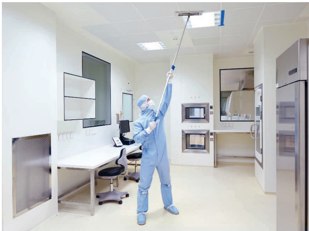
Durchführung einer Reinraum-Reinigung

Im stark regulierten Life-Science-Sektor stehen Unternehmen vor der Herausforderung, strengen Richtlinien zu genügen, ohne dabei die Effizienz oder Produktivität zu beeinträchtigen. Genau hier setzt Enzler an: Mit massgeschneiderten Dienstleistungen und innovativen Lösungen unterstützen wir unsere Kundinnen und Kunden dabei, ihre anspruchsvollen Anforderungen zuverlässig und nachhaltig zu erfüllen.