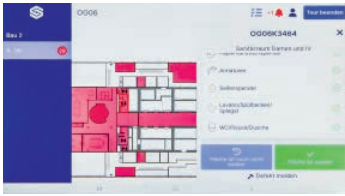
Digitale Arbeitsanweisungen mit «Soobr»

Reinigungsteams erhalten alle Aufgaben direkt auf ihrem Mobilgerät. Nach Erledigung werden die Arbeiten in der App dokumentiert – inklusive Zeitstempel. Die Kundinnen und Kunden können so jederzeit nachvollziehen, welche Leistungen wann durchgeführt wurden. In Bereichen mit erhöhten Hygieneanforderungen – wie etwa Sanitäranlagen – ermöglichen QR-Codes den Abruf des letzten Reinigungsdatums und das Hinterlassen von Feedback.