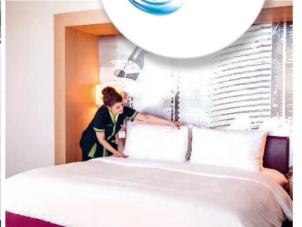
Heute: Eine Enzler-Mitarbeiterin bei der Hotelzimmer-Reinigung