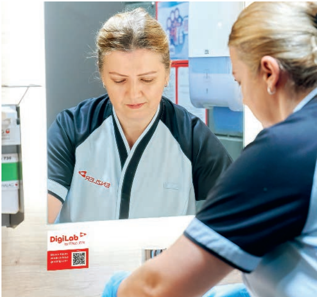
Abruf des letzten Reinigungsdatums via QR-Code – zugreifbar für alle

Transparenz ist in der modernen Gebäudereinigung ein entscheidender Faktor. Mit dem «Soobr»-System bietet die Enzler Gruppe eine vollständig digitale Plattform, die Reinigungsprozesse für Kundinnen und Kunden und Reinigungsteams gleichermassen klar und nachvollziehbar macht.