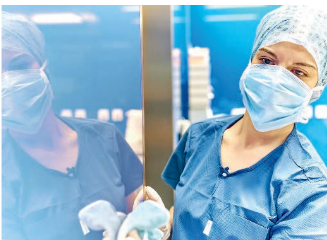
Zytostatika-Reinigung im Operationssaal

Die Entfernung solcher Rückstände erfordert spezialisierte Reinigungsverfahren. Herkömmliche Reinigungsmethoden können die Zytostatika-Kontamination nicht vollständig beseitigen. Wirkungsvolle Dekontamination gelingt erst durch abgestimmte Mehrkomponenten-Verfahren mit speziellen Reinigern wie alkalischen Lösungen in Kombination mit Alkohol oder Tensiden. Nur so lassen sich Rückstände zuverlässig entfernen. Ein durchdachtes Reinigungs- und Wartungskonzept – auch ausserhalb akuter Zwischenfälle – sollte deshalb fester Bestandteil des onkologischen Alltags sein. Diese Prozesse werden von unseren Enzlerh-tec-Fachmitarbeitenden durchgeführt, die umfassend geschult und mit persönlicher Schutzausrüstung ausgestattet sind. Regelmässige Monitoring-Massnahmen und Wischproben gewährleisten eine kontinuierliche Kontrolle und Sicherheit.