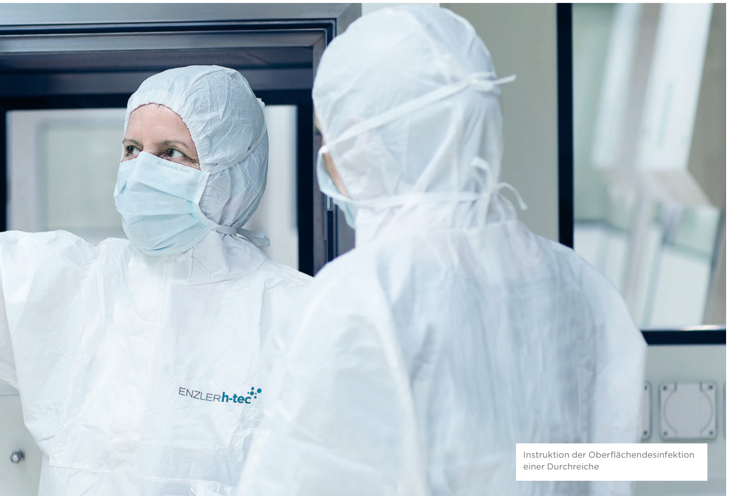
Instruktion der Oberflächendesinfektion einer Durchreiche