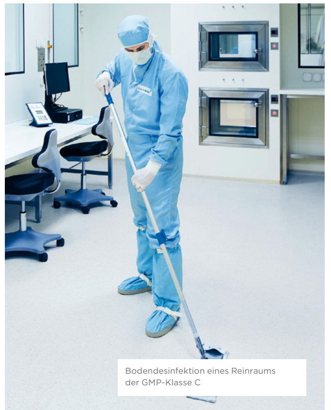
Bodendesinfektion eines Reinraums der GMP-Klasse C