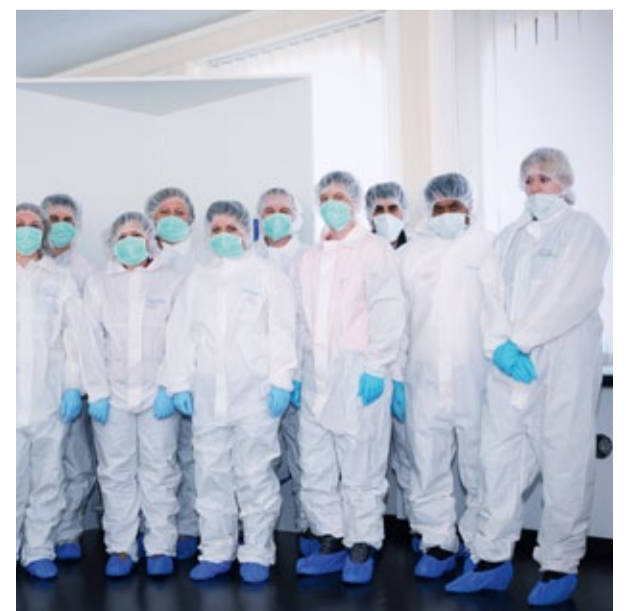
Höchste Hygienestandards müssen eingehalten werden

genau damit erfüllen wir unser Leistungsversprechen.