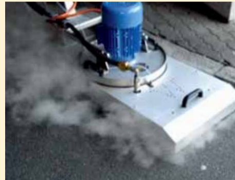
Während der Reinigung

weltweit zum Patent angemeldete Verfahren funktioniert 3-stufig unter Einwirkung von Dampf, umweltfreundlichem Reinigungsmittel und thermomechanischer Reinigung. Die Resultate sind verblüffend, denn konventionelle Reinigungsmaschinen sind nicht in der Lage, solche herausfordernden Reinigungsaufgaben zu lösen.