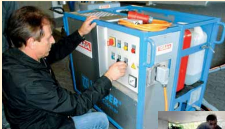
Vorbereitungen der Maschine

Man bleibt auf Strassen und Plätzen sicher gerne hin und wieder stehen, um etwas anzusehen oder sogar zu bestaunen. Aber sicher nicht, weil man auf einen Kaugummi gestanden ist und kaum mehr weiterkommt. Oft verunzieren nicht nur frische Kaugummis, sondern vor allem eingetretene und eingetrocknete das Strassen- und Stadtbild. Wer genau auf den Boden schaut, sieht diese meist unappetitlich beige-grauen Flecken fast überall, vor allem an von Fuss-