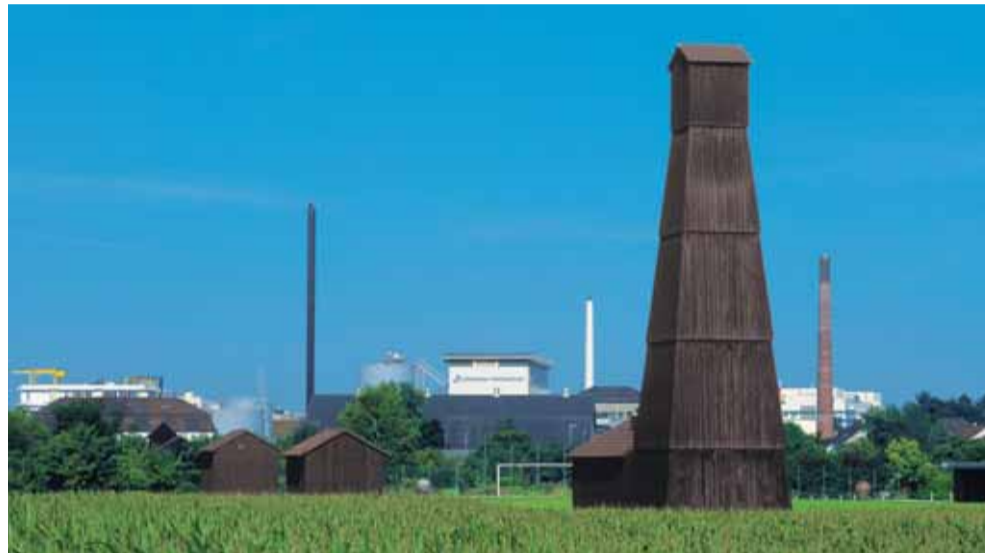
Vereinigte Schweizerische Rheinsalinen

Die Schweizer Rheinsalinen sind ein Unternehmen aus der Pionierzeit der Industrie und gewinnen seit 1837 den lebenswichtigen Rohstoff Salz. Salz war eine der zentralen Ressourcen der chemischen Industrie im Raum Basel und ebenso die Grundlage für die Badekultur in Rheinfelden AG und anderen Solbädern der Schweiz. Das Salz am Rhein beendete die jahrhundertelange Abhängigkeit vom Ausland und gab den damals jungen Kantonen Basel-Landschaft und Aargau die finanzielle Startbasis für den Aufbau.