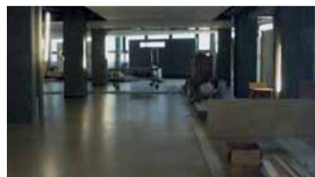
Dazwischen liegen 10 Tage

frästen, und die Enzler-Equipe reinigte parallel im Schichtbetrieb. Konkret heisst das zum Beispiel, dass kaum die Spuren der Baumeister beseitigt waren, als schon wieder erste Verschmutzungen durch die Schreiner entstanden. Schliesslich kam der Zeitdruck dazu. Für die Reinigung gilt dann oft: Den Letzten beißen die Hunde. Sicherheitshalber waren wir auch am Eröffnungstag mit Pikett und Notfalldienst jederzeit einsatzbereit.