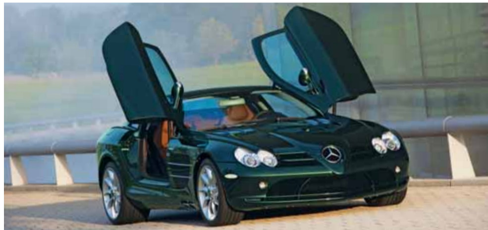
Unsere Reinigungsmaschinen haben ein paar PS weniger, hier der Mercedes-Benz McLaren SLR

Aber auch bei uns gibt es Sterne. Manchmal waren wir richtig stolz auf unsere neuen Reinigungsmaschinen. Einige neue Innovationen wurden nach genauer Prüfung mit Freude begrüsst und in den Arbeitsalltag integriert. Sie gaben uns die Möglichkeit, auf immer komplexere Materialien und -mische zu reagieren. Und wie bei der Mercedes-Benz Automobil AG geht bei uns die Entwicklung weiter.