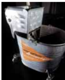
Unser «Mercedes» auf 4 Rädern

Glänzende Augen waren und sind beim Betrachten der neusten Modelle garantiert. Viele Modelle waren zu ihrer Zeit innovativ, und einige davon haben ein Stück Autogeschichte geschrieben. Für glänzende Augen können wir mit unserer Arbeit zwar höchst selten sorgen, dafür aber, dass auch die zukünftigen Neuheiten im blitzsauberen, glänzenden Umfeld präsentiert werden.