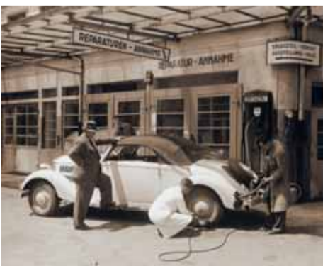
Es begann 1926 an der Badenerstrasse. Der erste europäische Mercedes-Benz-Betrieb.