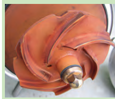
Aussehen vor der Reinigung

Beispiel einer Reinigung: Problem: Rouging bei einer Pumpe