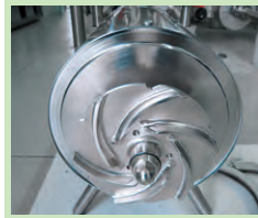
Aussehen nach der Reinigung