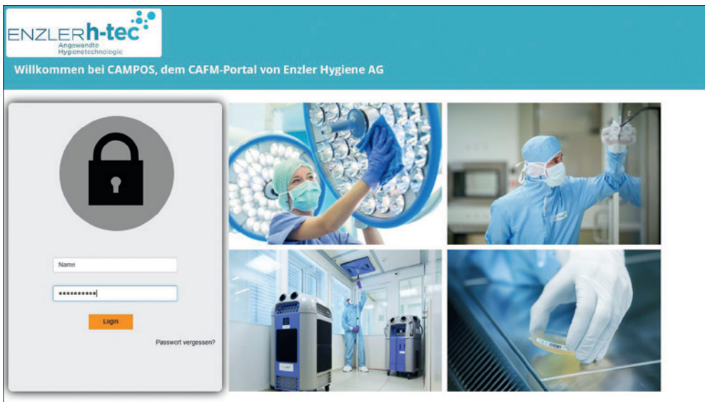
Login bei CAMPOS auf www.enzlerh-tec.com

Werkzeug für all diese Belange. So können Wartungsaufträge geplant, Störungen erfasst und weitergemeldet sowie Zuständigkeiten verwaltet werden.